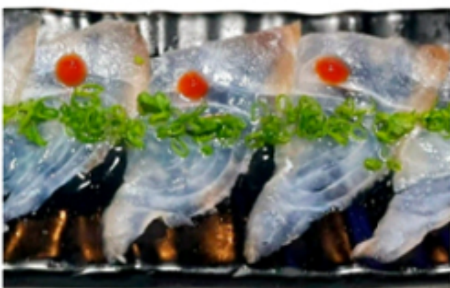
Carpaccio de Tilápia

Cubos de Tilápia fresca com uma seleção de pimentas, gengibre, cebola roxa, limão, azeite e crispy de alho poró. 200g.